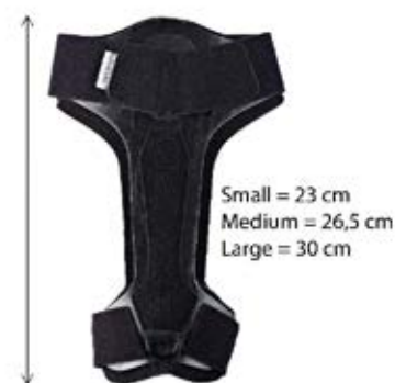
Mål: Plastdelens lengde.