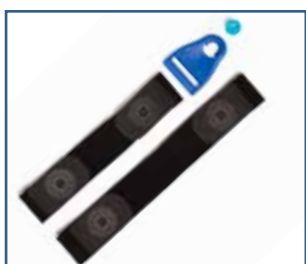
79021 Sett til walker, 8 spenner og 4 bånd (S - XXL)