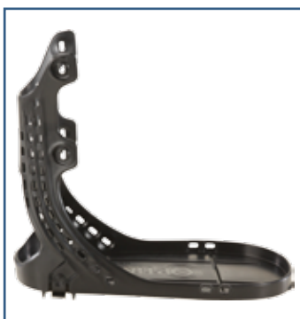
79019 Walker Ramme Åpen hæl (S - XXL)