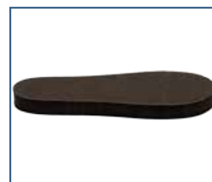
79026 SBI Innlegg enkelt svart (S - XXL)