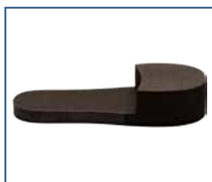
79025 SBI Innlegg ved amputasjon (S - XXL)