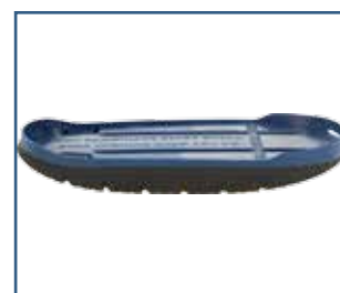
79023 SBI Total rullesåle (S - XXL)