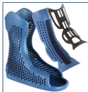
79020 komplett innerdel til walker (S - XXL)