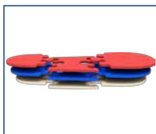
79024 SBI Innlegg 3+3 sett (S - XXL)