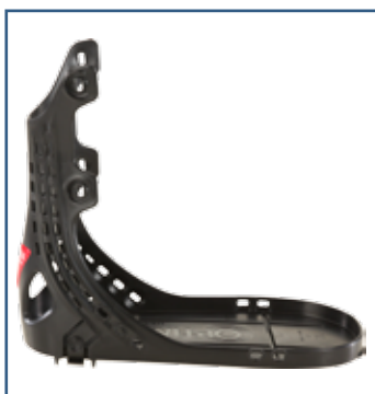
79018 Walker Ramme Lukket hæl (S - XXL)