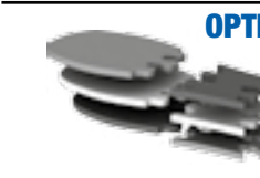
OPTIMA KIT 3x3